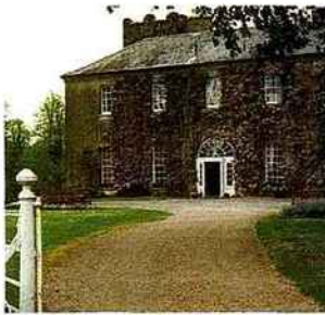
Ci-dessus, le manoir irlandais de Ballymaloe. En haut, à dr., cueillette d'herbes aromatiques dans le potager et, dessous, un cours de cuisine.