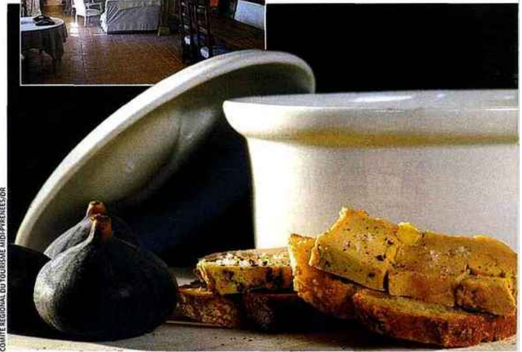
COMITÉ REGIONAL DU TOURISME MIDI-PYRÉNÉES/SOR